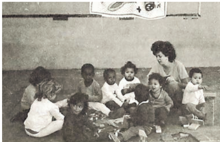
Crianças e monitora da Creche Jesus de Nazaré, no início da década de 1980

à OCSAMC, em 1979: a Escola de Marcenaria, em funcionamento até hoje, a Chácara dos Meninos (desativada em 1988), o Posto de Saúde Piloto, a Creche “Jesus de Nazaré” (assumida pela prefeitura, em 1992), o Projeto Saúde e Educação Popular (com a criação, em 1982, de programas de complementação alimentar e assistência médica domiciliar) e, mais recentemente, o Serviço de Liberdade Assistida.