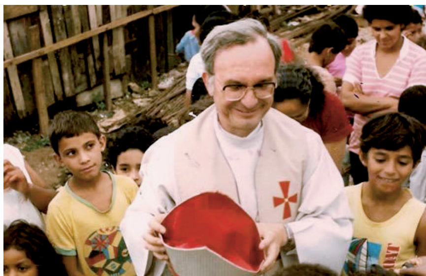
Dom Luciano de Almeida, falecido em 2006

te número de meninos de rua que se proliferavam não só na Praça da Sé, em São Paulo, mas pelas grandes cidades do país, procurou os educadores do Projeto Pedagogia de Rua para troca de experiências.