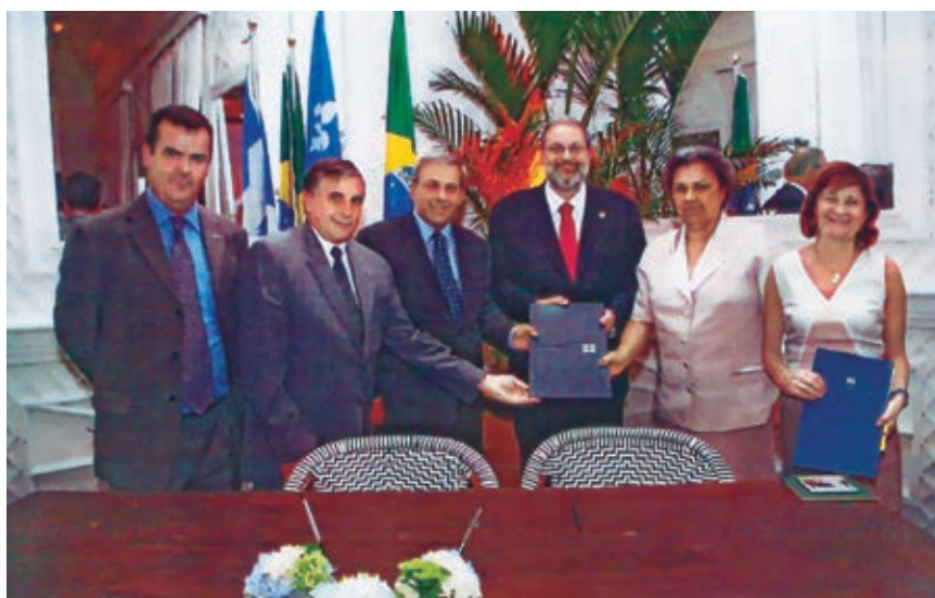
Assinatura do Protocolo de Cooperação Técnica

A parceria com o Canadá também resultou num termo de cooperação técnica entre a Fundação CASA, a OSCAMC e o Centre Jeunesse de La Montérégie, com o objetivo de promover a troca de experiências entre as três instituições. Assinado em novembro de 2009, o termo prevê o intercâmbio de informações em métodos e práticas clínicas utilizadas por cada