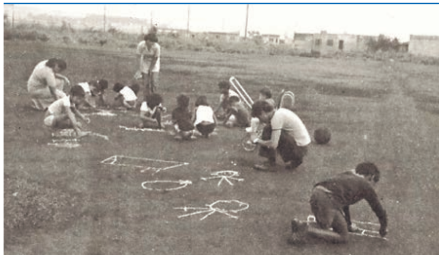
Atividades de recreação num posto do Programa de Complementação Alimentar