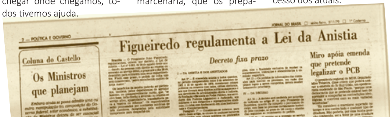
Jornal de 1979, ano em que a Organização Comunitária Santo Antônio Maria de Claret foi fundada

Para construir essa história, percorremos um longo caminho feito de várias etapas e projetos, que por sua vez são responsáveis pelo sucesso dos atuais.